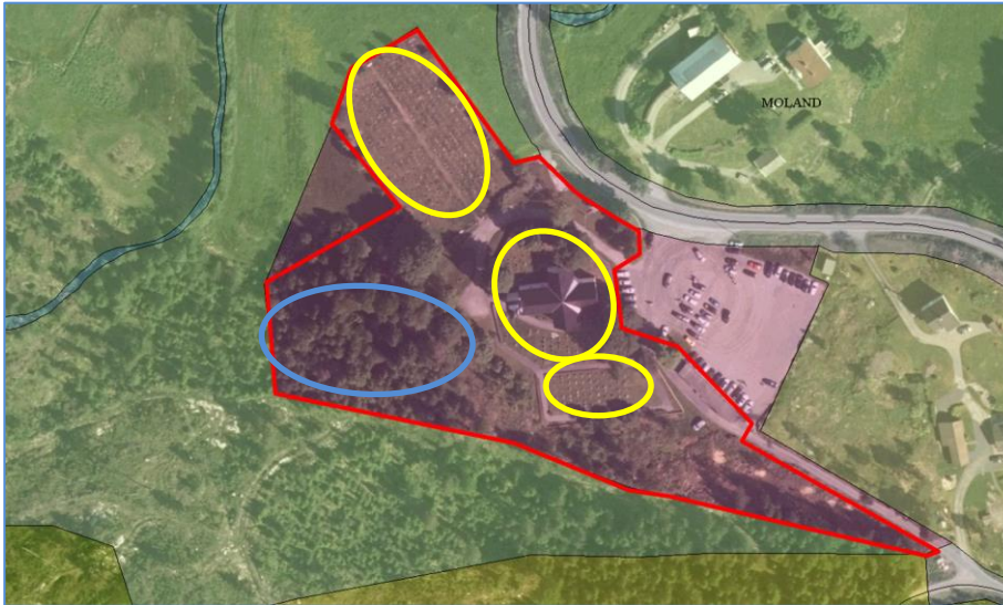
Kart 1: planområdet

Rundt kirkebygget og nordvest og sør for kirken ligger eksisterende gravfelter (områder markert gult på kart 1). Gravfeltet utvides like sørvest for kirken, mellom to eksisterende deler av kirkegården (området markert blå på kart 1).