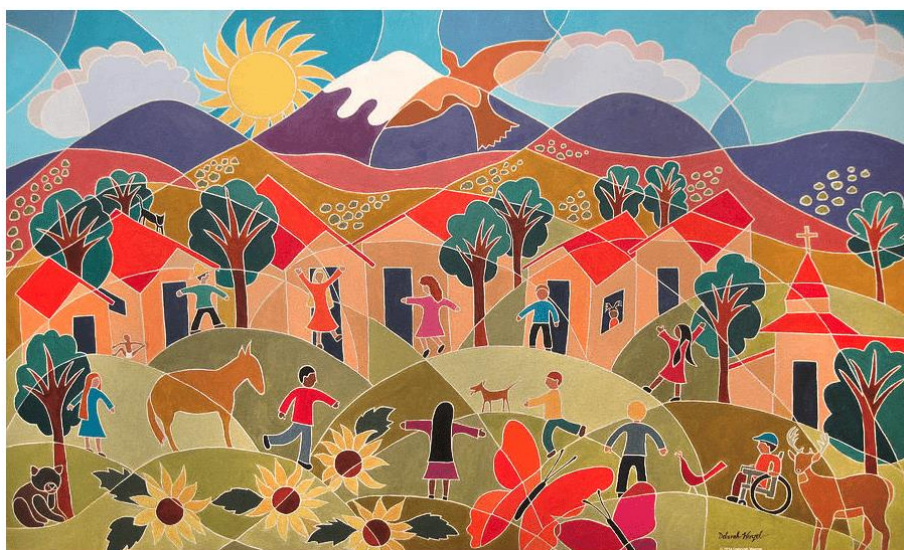
It Takes a Village, D. Wenzel